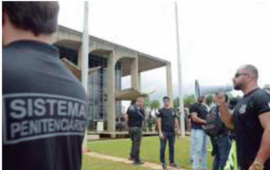
Agentes penitenciários em frente ao Ministério da Justiça, no centro de Brasília

Segundo Vieira, o país teria que aumentar em 30 vezes o número de agentes penitenciários para atender à recomendação do Conselho Nacional de Política Criminal e Penitenciária do Ministério da Justiça, de cinco presos para cada agente. “Em Brasília, temos 850 candidatos aptos a irem para curso de formação e serem nomeados”, diz e acrescenta que os estados preferem tercei-