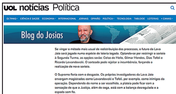
Blog do Josias - Sorteio submete Lava Jato a uma loteria togada - Josias de Souza - 24/1/17

No dia seguinte, o mesmo matinal sinalizou a "novidade": Temer agora está livre do peso de escolher o novo relator - o que poderia gerar acusações