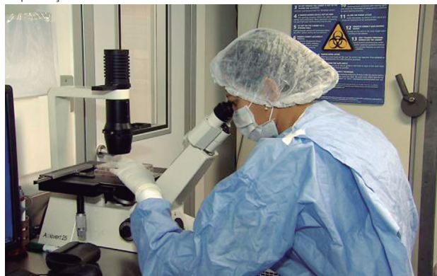
Pesquisadores fazem o sequenciamento do genoma do vírus Zika

estão em preparação. Enquanto alguns avançaram para ensaios clínicos, uma vacina julgada segura o suficiente para uso em mulheres em idade fértil pode não ser totalmente licenciada antes de 2020”, disse Chan em evento realizado ontem (1º) em Genebra, na Suíça.