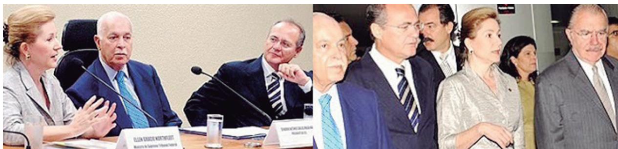
Ellen Gracie, primeira mulher a integrar a Corte Suprema

Há quem acredite que esta última fase, por sua vez, seja meramente protocolar.