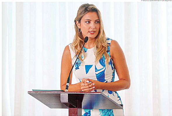
A primeira-dama Maroela Temer, que teve celular clonado em 2016