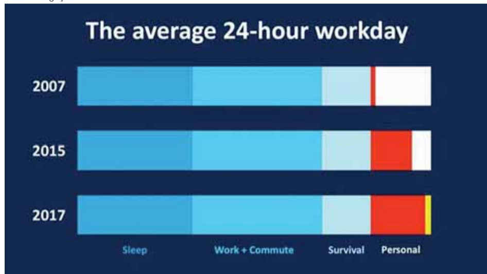
gráfico indica que o sono e o trabalho ocupam cerca de dois terços do dia das pessoas, não importa o ano. O mesmo acontece com as atividades de sobrevivência, tais como tomar banho e comer.

Baseando-se em informações coletadas pelo Bureau of Labor Statistics e pelo aplicativo Moments, que acompanha o uso de smartphone, o