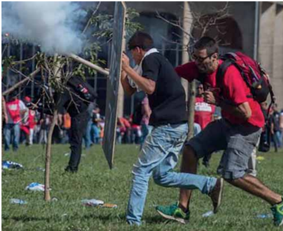
Representante da ONU também pediu que manifestantes que “exercem direito à manifestação de forma pacífica”

para a garantia da lei e da ordem no Distrito Federal”.