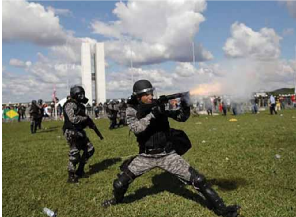
Diretor do centro de informações da ONU no Brasil se disse “satisfeito que a tranquilidade tenha sido em parte restaurada” pela revogação da convocação do Exército