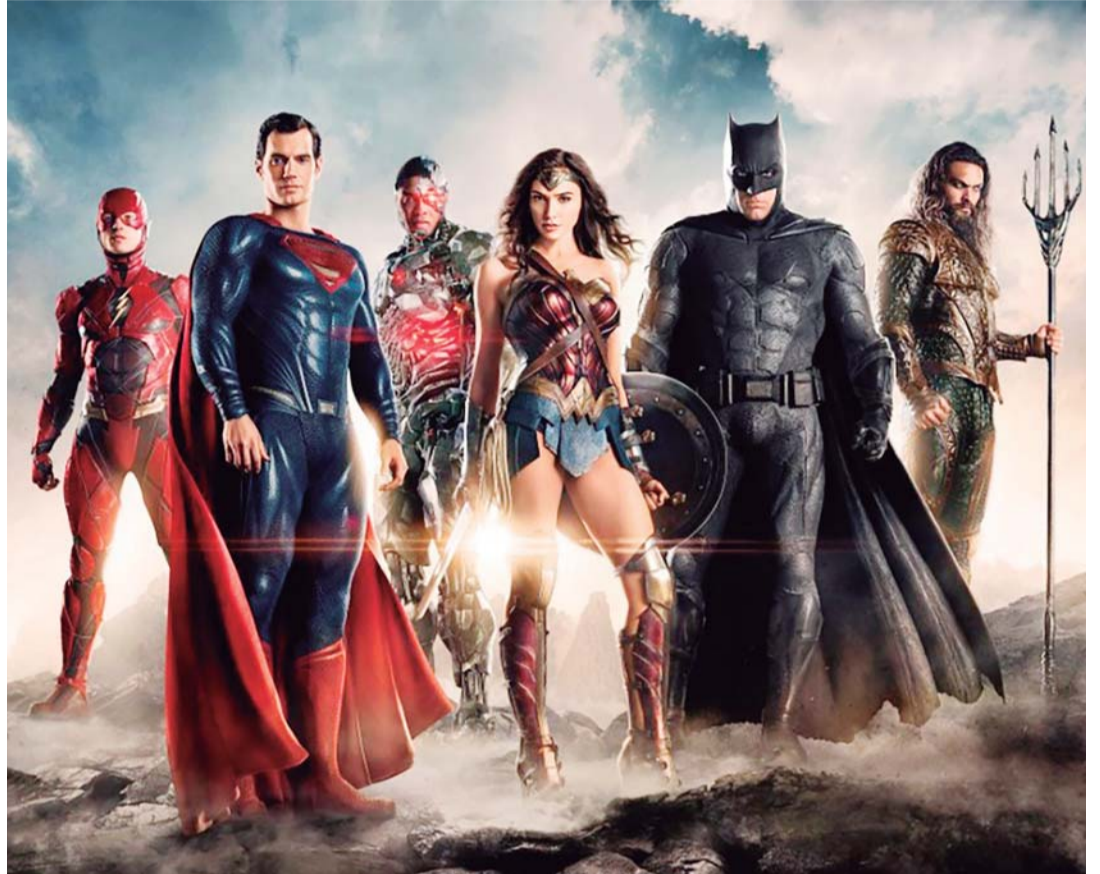
Liga da Justiça: próxima superprodução tão esperada da Warner DC