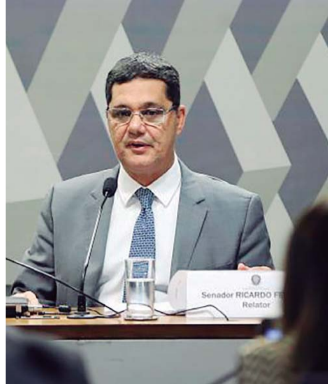
O senador Ricardo Ferraço faz a leitura do relatório sobre a proposta de reforma trabalhista na Comissão de Assuntos Sociais do Senado

O senador Paulo Paim (PT-RS) apresentou voto em separado contrário à reforma trabalhista (PLC 38/2017) na Comissão de Assuntos Sociais (CAS). Paim iniciou a leitura do voto logo após o relator do projeto, Ricardo Ferraço (PSDB-ES), apresentar seu parecer favorável à proposta.