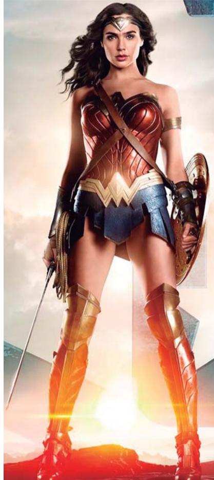
A Miss Israelense 2004, Gal Gadot representa a Mulher-Maravilha

Muitos efeitos são bem desempenhados neste filme que mostra uma Mulher-Maravilha intencionalmente ingênua, mas destemida, inocente e sonhadora, sendo amparada pelo piloto Steve que vê nela também uma proteção depois de salvá-lo. Talvez esperássemos uma mulher mais brutal como Scarlett Johansson, a ruiva Viúva Negra da Marvel, mas Diana da DC é decidida com toda sua amabilidade. Essa bela morena Gal Gadot foi Miss Israel em 2004, o filme inicialmente foi proibido de se passar