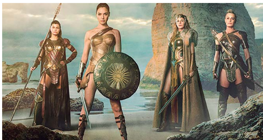
Princesa Diana e as amazonas da ilha paraíso Themyscira

Diana é uma meta humana, filha de Zeus e Hipólita, a rainha das amazonas, por isso sua condição de sucesso a todos os embates. Um filme com boa emoção de aeroplanos