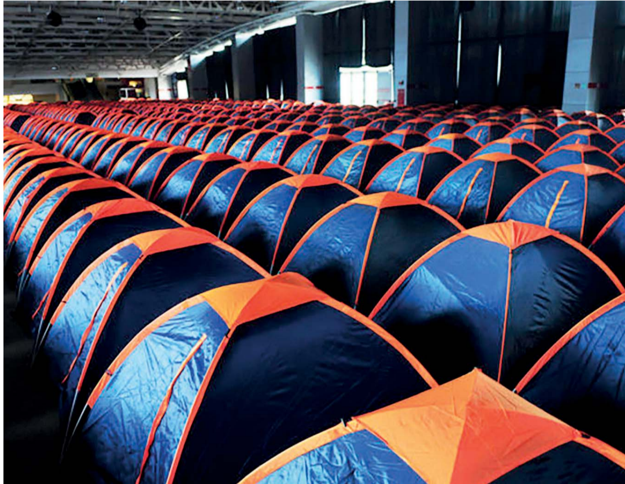
Barracas de camping da Campus Party Brasília, que ocorre nos dias 15, 16 e 17 de junho no Centro de Convenções Ulysses Guimarães

Centro de Convenções Ulysses Guimarães abrigará 4 mil campuseiros de 14 a 18 de junho. De quinta (15) a sábado (17)