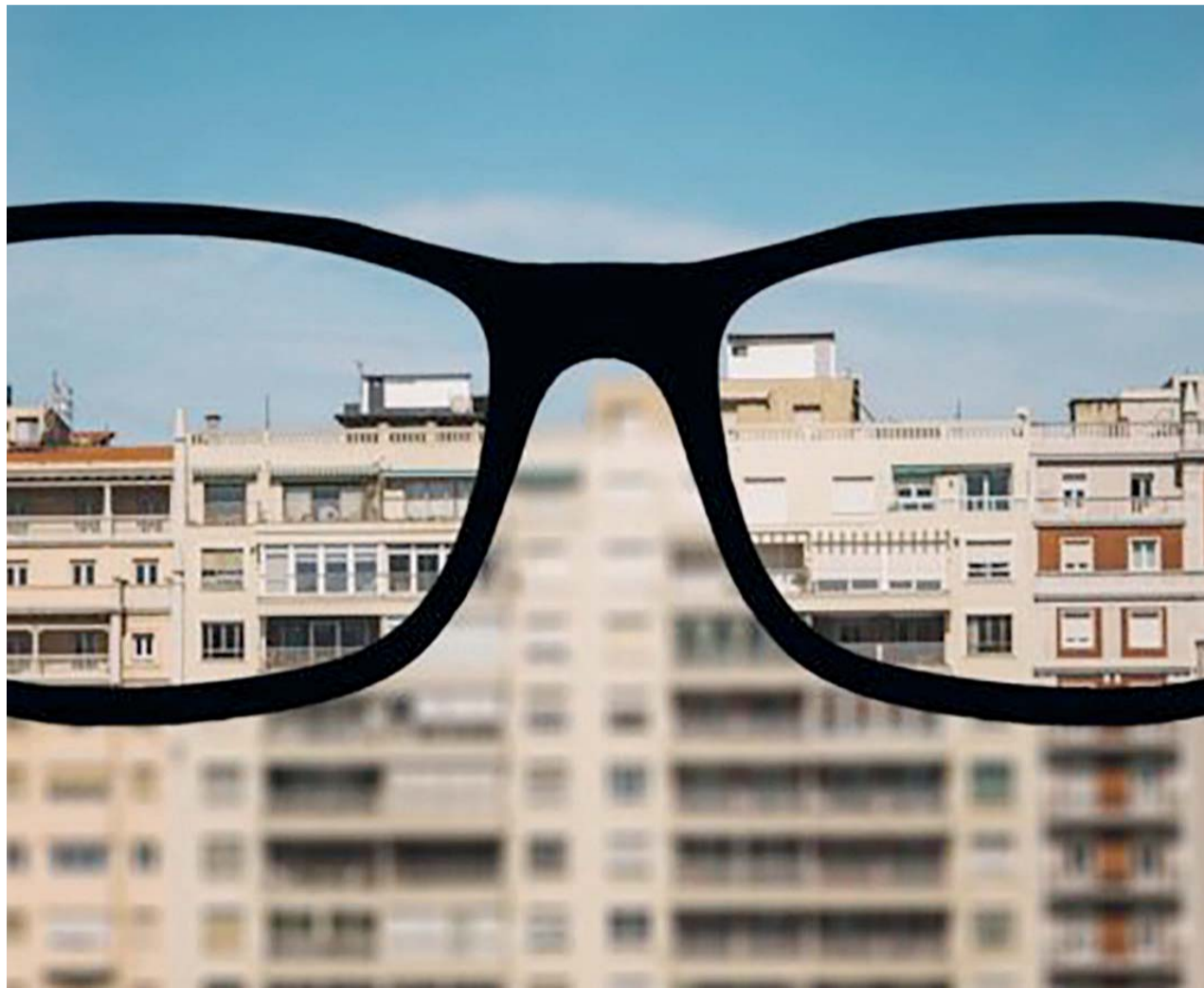
A miopia é causada pela combinação de fatores genéticos e ambientais que alteram o desenvolvimento normal do olho

Nos últimos 50 anos, o número de pessoas míopes duplicou. Estima-se que em 2020 um terço da população mundial terá o problema