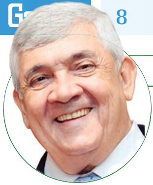
■ HD Hércules Dias blog: www.herculesdias.com.br