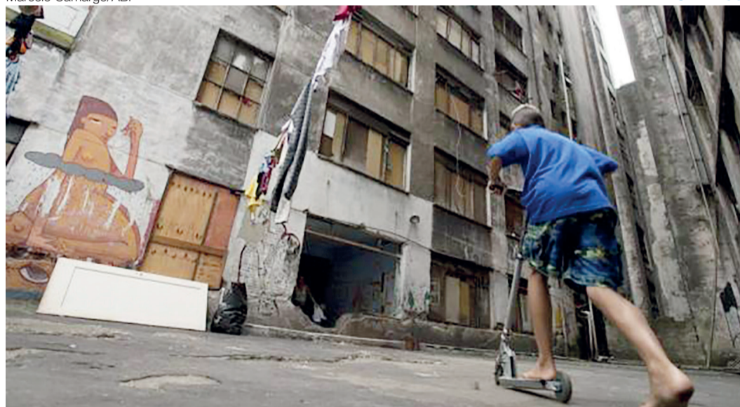
Relatório diz que Brasil tem regiões cujos dados apontam extrema desigualdade social