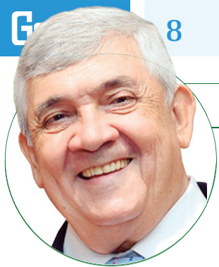
■ HD Hércules Dias blog: www.herculesdias.com.br