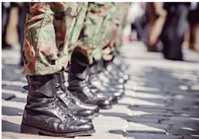
Parecer defende competência da PM para investigar crimes dolosos contra a vida cometidos por policiais militares contra civis