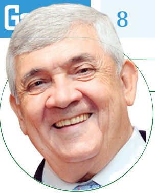
■ HD Hércules Dias blog: www.herculesdias.com.br