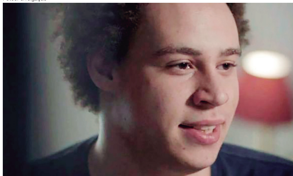
O jovem britânico se converteu em ‘herói’ após deter o WannaCry, mas a boa fama durou pouco

Em maio passado, um ciberataque “de dimensão nunca antes vista” conseguiu bloquear o acesso a mais de 20 mil computadores de instituições públicas e privadas de 150 países.