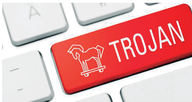
Kronos, que ganhou o nome de um deus mitológico, foi programado como um vírus Trojan

O vírus WannaCry infectou a rede online do sistema de saúde pública britânico, o gigante de telecomunicações espanhol Telefónica e várias instituições em Rússia, Estados Unidos, China, Itália, Vietnã e Taiwan, entre outros.