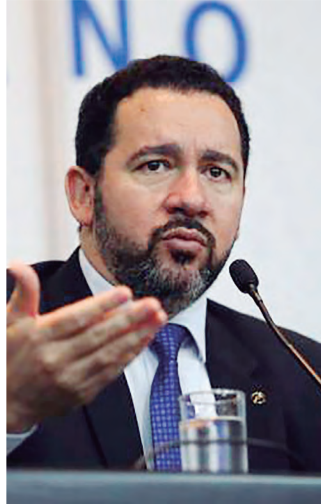
O ministro Dyogo Oliveira disse que “não é verdade que o governo reduziu o salário mínimo”

O ministro do Planejamento, Dyogo Oliveira, publicou um vídeo em redes sociais para dizer que são falsas as notícias na internet de redução do salário mínimo.