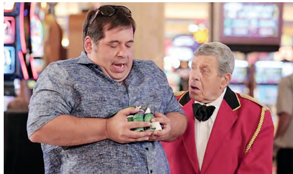
Jerry Lewis no filme “Até que a Sorte Nos Separe 2”