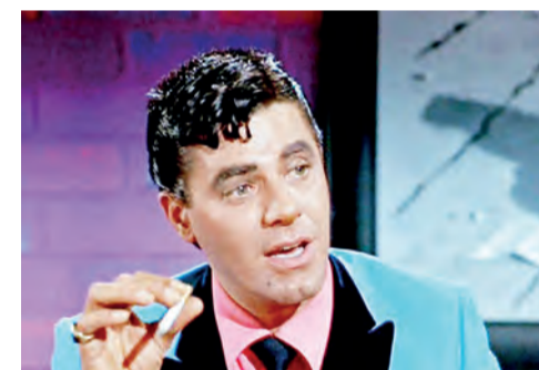
Jerry Lewis no filme “O Professor Aloprado”

A morte de Jerry Lewis aos 91 anos, no último domingo, fez muitos fãs irem às redes sociais prestar suas homenagens ao ídolo. Entre os milhares de admiradores, atores, atrizes e diretores falaram da importância do comediante para a história do cinema.