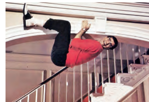
Jerry Lewis no filme “O Terror das Mulheres”