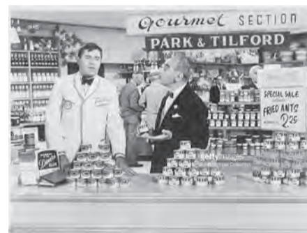
Jerry Lewis no filme “Errado pra Cachorro”