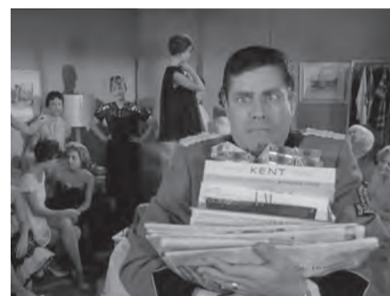
Jerry Lewis no filme “O Mensageiro Trapalhão”