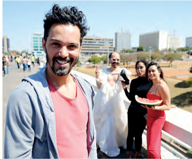
Grupo brasileiro Andaime Cia. de Teatro abre na terça (22) a programação do 18º Cena Contemporânea.

Grupo brasileiro Andaime Cia. de Teatro abre na terça (22) a programação do 18º Cena Contemporânea