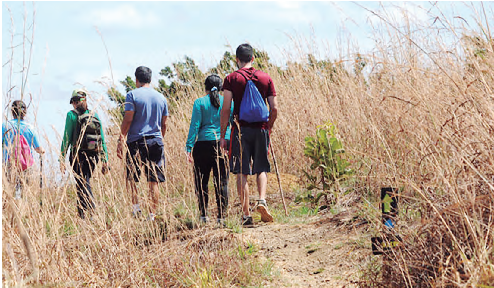
O Lago Norte ganha, neste domingo (27), a Trilha Bomtempo, que faz parte do projeto Ecotrilhas da região administrativa

Os ciclistas terão ainda a seu dispor QR Codes