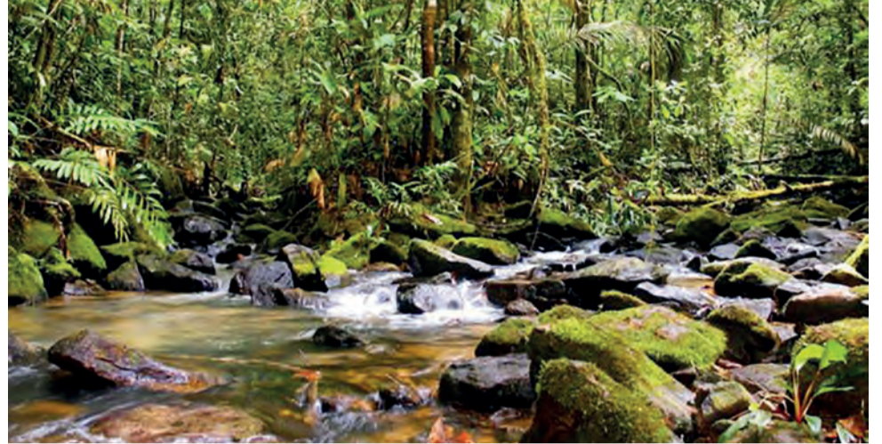
A reserva biológica Maicuru está ao menos parcialmente dentro da RENCA