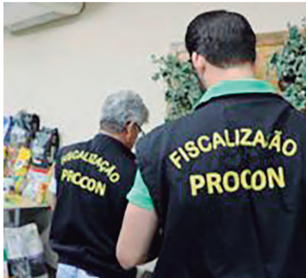
Operação do Procon foi feita após denúncias