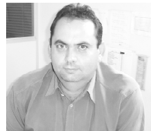
Iris Gonzaga foi vereador e candidato a prefeito