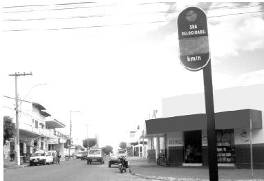
Lombadas Eletrônicas ou Máquinas de Dinheiro? Pg: 2

Novamente a Gazeta do Estado vem pedir que os responsáveis pelo combate à dengue tomem providências mais eficientes no combate ao mosquito que ameaça o bem estar de toda a nossa sociedade.