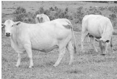
Combate a Aftosa