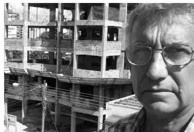
Um pioneiro de Valor