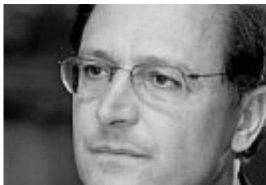
Disputa pelo vice de Alckmin