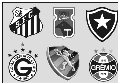
Time Grande é isso aí