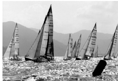
Regata Volta ao Mundo