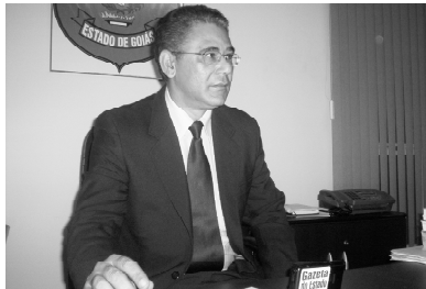
Atuação em prol da sociedade de Caldas Novas