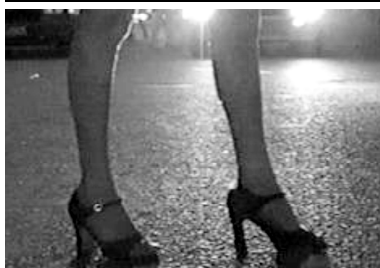
Prostituição a olhos vistos

Todas as pessoas fisicamente habilitadas, ou não, devem exigir do Poder Público medidas que garantam qualidade de vida na evolução de suas atividades com a finalidade de gerar auto-estima e cidadania ao cidadão. ■