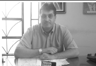
Vida de servo