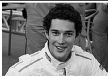
Bruno Senna vence na