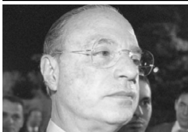
O último desafio

Com o documento enviado ao Relator do processo, Ministro César Peluso, o Procurador espera e requer que o TSE reconsidere a decisão agravada ou que submeta o Agravo Regimental ao julgamento do Tribunal onde deverá ser atendido. ■