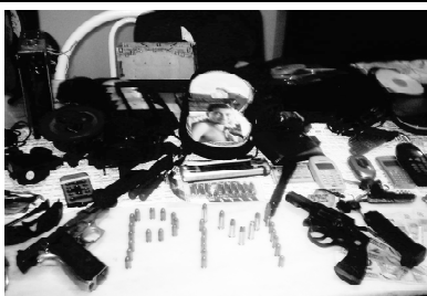
Pegaram mais um