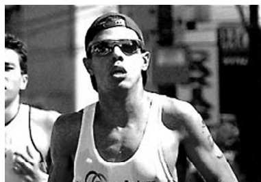
Goiano vence Duatlo