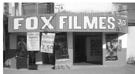
Rua 01 Qd. 15 Lt. 01 Itaici 1

A FOX agradece a você cliente, que nos prestigia diariamente com sua ilustre presença e convida você que ainda não teve a oportunidade de vir degustar o mais saboroso churrasquinho da cidade, além da cerveja mais gelada uma enorme variedade de porções, e um atendimento cordial com um preço justo.