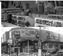
Av. Bento de Godoy 648 Centro (64) 3455-5623