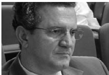
Decisão beneficia Agência Ambiental