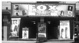
Av. B Qd 37 Lt. 13 sl. 01 Nova Vila - Fone: (64) 3454-4630