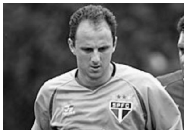
Rogério Ceni não acredita