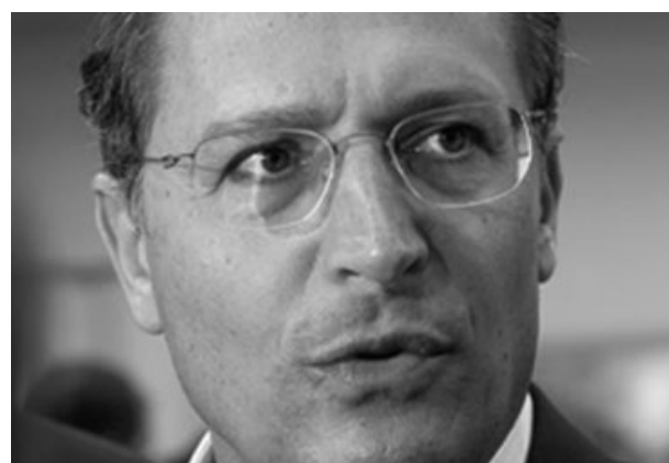
Decisões no ar