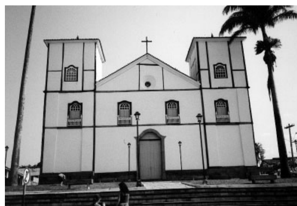
A cidade histórica de Goiás