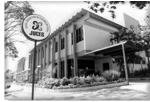
Sede da JUCEG em Goiânia

Todavia, visionariamente nós elaboramos um projeto, encaminhado para o Governo para que o terreno fosse destinado para a instalação de um Vapt Vupt", disse e completou, "o projeto da construção já está aprovado e não foi efetivado por questões financeiras governamentais", declarou.