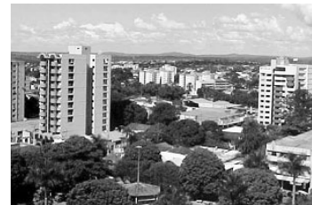
A JUCEG em Caldas Novas funciona no prédio da ACICAN

Mas, infelizmente, a Junta Comercial ainda não conseguiu sua sede própria. Suas instalações funcionam na ACICAN. "Ficamos aproximadamente dois anos lutando pela conquista do terreno para a construção.