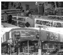
Av. Bento de Godoy 648