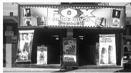
Av. B Qd 37 Lt. 13 sl. 01 Nova Vila - Fone: (64) 3454-4630