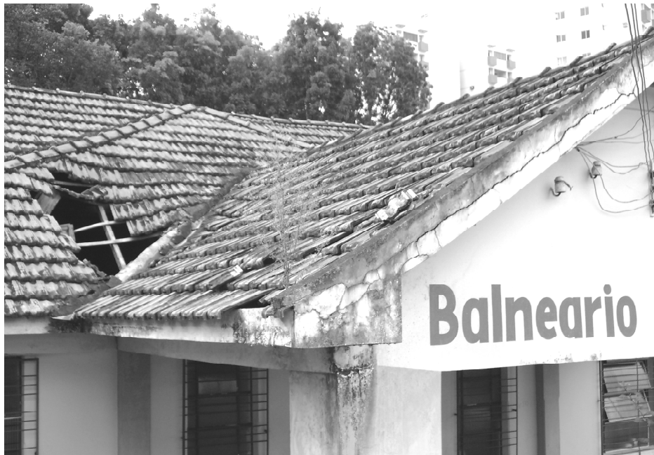
Esta foto foi tirada ontem às 16h e comprova que até esta data nada mudou

No dia 19 de abril, a Gazeta do Estado lançou matéria a respeito do desca-