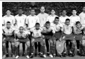
A emoção começa hoje