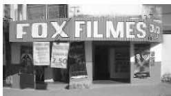
Rua 01 Qd. 15 Lt. 01 Itaipó I

A FOX agradece a você cliente, que nos prestigia diariamente com sua ilustre presença e convida você que ainda não teve a oportunidade de vir degustar o mais saboroso churrasquinho da cidade, além da cerveja mais gelada, uma enorme variedade de porções e um atendimento cordial com um preço justo.