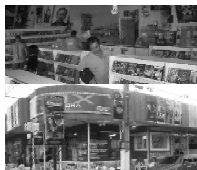
Av. Bento de Godoy 648