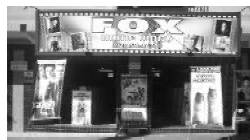
Av. B Qd 37 Lt. 13 sl. 01 Nova Vila - Fone: (64) 3454-4630