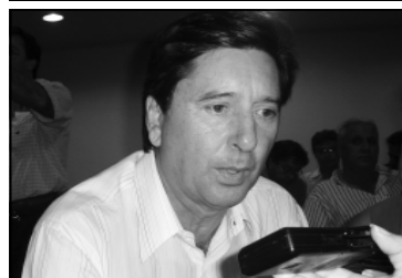
Copa política de Goiás