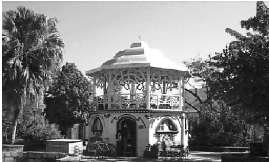
Coreto da praça central de Goiás Velho

Considerado como um dos maiores festivais temáticos do mundo, o FICA apresenta filmes e documentários com a ótica voltada para causas ambientais, desde denúncias até maravilhas da natureza. Muitos universitários participam deste evento.