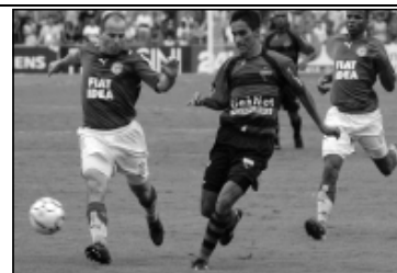
Brasileirão antes da Copa