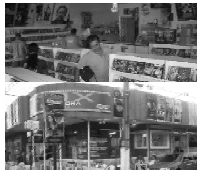
Av. Bento de Godoy 648