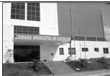
Legislativo presente na comunidade