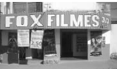
Rua 01 Qd. 15 Lt. 01 Itaici 1

A FOX agradece a você cliente, que nos prestigia diariamente com sua ilustre presença e convida você que ainda não teve a oportunidade de vir degustar o mais saboroso churrasquinho da cidade, além da cerveja mais gelada, uma enorme variedade de porções e um atendimento cordial com um preço justo.