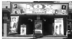
Av. B Qd 37 Lt. 13 sl. 01 Nova Vila - Fone: (64) 3454-4630