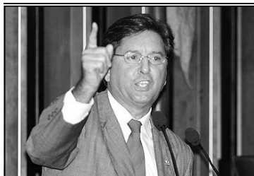
Desordem política em Goiás