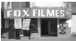
Rua 01 Qd. 15 Lt. 01 Itaici 1

A FOX agradece a você cliente, que nos prestigia diariamente com sua ilustre presença e convida você que ainda não teve a oportunidade de vir degustar o mais saboroso churrasquinho da cidade, além da cerveja mais gelada, uma enorme variedade de porções e um atendimento cordial com um preço justo.