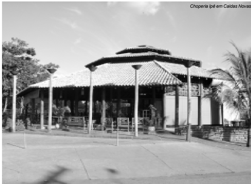
Choperia Ipê em Caldas Novas

O Brasil vai parar para assistir os dribles de Ronaldinho Gaúcho, os belos passes de Kaká e vai manter muita esperança nos gols de Ronaldo Fenômeno e Adriano Imperador.