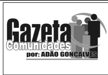
Espaço aberto para a população