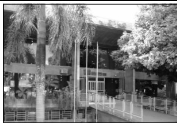
Catalão doa terreno para a Vara do trabalho