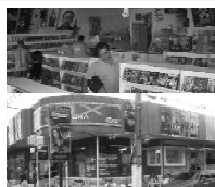
Av. Bento de Godoy 648