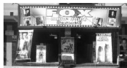
Av. B Qd 37 Lt. 13 sl. 01 Nova Vila - Fone: (64) 3454-4630