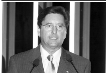
PT quer ser vice de Maguito