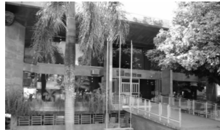
Prefeitura de Catalão