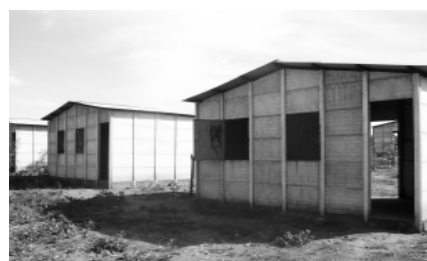
Novas casas da Comunidade