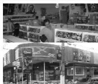
Av. Bento de Godoy 648