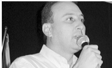
Prefeito Marcelo Coelho

As ações da prefeitura estão sendo centradas em vários setores e envolve infraestrutura, saúde, meio ambiente, assistência social, dentre várias outras. O trabalho do prefeito Marcelo Coelho visa, principalmente, uma qualidade de vida digna da população de Goiatuba.