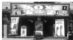
Av. B Qd 37 Lt. 13 sl. 01 Nova Vila - Fone: (64) 3454-4630