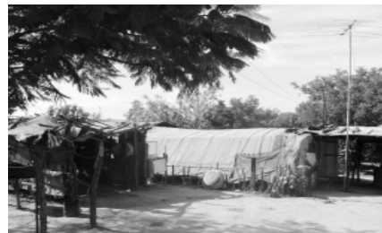
Antiga moradia da Comunidade