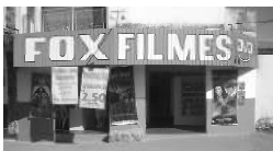
Rua 01 Qd. 15 Lt. 01 Itaipá I

A FOX agradece a você cliente, que nos prestigia diariamente com sua ilustre presença e convida você que ainda não teve a oportunidade de vir degustar o mais saboroso churrasquinho da cidade, além da cerveja mais gelada, uma enorme variedade de porções e um atendimento cordial com um preço justo.