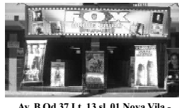
Av. B Qd 37 Lt. 13 sl. 01 Nova Vila - Fone: (64) 3454-4630