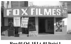
Rua 01 Qd. 15 Lt. 01 Itaiçá I

A FOX agradece a você cliente, que nos prestigia diariamente com sua ilustre presença e convida você que ainda não teve a oportunidade de vir degustar o mais saboroso churrasquinho da cidade, além da cerveja mais gelada, uma enorme variedade de porções e um atendimento cordial com um preço justo.