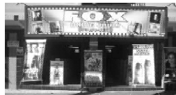
Av. B Qd 37 Lt. 13 sl. 01 Nova Vila - Fone: (64) 3454-4630