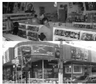
Av. Bento de Godoy 648