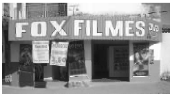
Rua 01 Qd. 15 Lt. 01 Itaiçá I

A FOX agradece a você cliente, que nos prestigia diariamente com sua ilustre presença e convida você que ainda não teve a oportunidade de vir degustar o mais saboroso churrasquinho da cidade, além da cerveja mais gelada, uma enorme variedade de porções e um atendimento cordial com um preço justo.