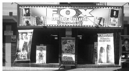
Av. B Qd 37 Lt. 13 sl. 01 Nova Vila - Fone: (64) 3454-4630