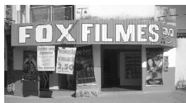
Rua 01 Qd. 15 Lt. 01 Itaicí I

A FOX agradece a você cliente, que nos prestigia diariamente com sua ilustre presença e convida você que ainda não teve a oportunidade de vir degustar o mais saboroso churrasquinho da cidade, além da cerveja mais gelada, uma enorme variedade de porções e um atendimento cordial com um preço justo.