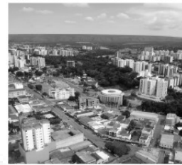
Este espaço pode ser seu!

Anuncie seu produto ou serviço e ganhe um mundo de vantagens