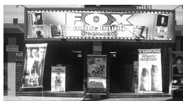
Av. B Qd 37 Lt. 13 sl. 01 Nova Vila - Fone: (64) 3454-4630