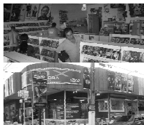
Av. Bento de Godoy 648