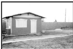
Chalé de 01 quartos quadra 138 apenas R$ 17.000,00

SITE: www.caldasnovasresortthermal.com.br