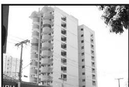
Apartamento residencial Monte Carlo 02 quartos sendo um suite, ao lado do Bradesco no 7º Andar somente R$ 75.000,00