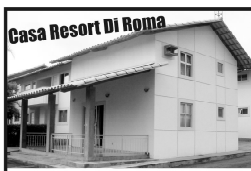
Troca-se casa de 02 quartos, totalmente mobiliada, por casa do mesmo condomínio de 01 quarto.