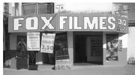
Rua 01 Qd. 15 Lt. 01 Itaici I

A FOX agradece a você cliente, que nos prestigia diariamente com sua ilustre presença e convida você que ainda não teve a oportunidade de vir degustar o mais saboroso churrasquinho da cidade, além da cerveja mais gelada, uma enorme variedade de porções e um atendimento cordial com um preço justo.