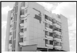
Residencial Orquídeas 02 quartos sendo um suite, demais dependências por R$ 70.000,00 financiados em 35 meses e a entrega é imediata

Temos clientes cadastrados para Casa, de 02 e 03 quartos, damos assistência jurídica, enviamos cobranças em holetos bancários protestáveis.