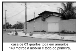
casa de 03 quartos toda em armários 140 metros a mobília é toda de primeira, e cerâmica é toda de primeira, tem que ver, apenas R$ 110.000,00

Temos clientes cadastrados para Casa, de 02 e 03 quartos, damos assistência jurídica, enviamos cobranças em holetos bancários protestáveis.