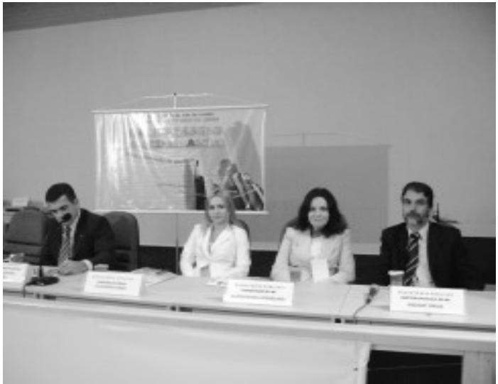
Aconteceu na noite de quarta-feira, 20, a 5ª Audiência Pública promovida pelo Ministério Público de Goiás, realizada no plenário da Câmara Municipal de Caldas Novas. Estiveram presentes o Procurador Geral de

Ministério Público ouve sugestões e reclamações da população