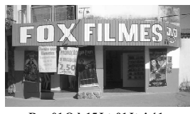
Rua 01 Qd. 15 Lt. 01 Itaici 1

A FOX agradece a você cliente, que nos prestigia diariamente com sua ilustre presença e convida você que ainda não teve a oportunidade de vir degustar o mais saboroso churrasquinho da cidade, além da cerveja mais gelada, uma enorme variedade de porções e um atendimento cordial com um preço justo.