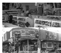
Av. Bento de Godoy 648