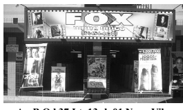
Av. B Qd 37 Lt. 13 sl. 01 Nova Vila - Fone: (64) 3454-4630