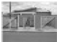
Casa Nova em Itanhangá, com 3 quartos, sala, cozinha, banheiro, sala de jantar, garagem, piscina, churrasqueira, etc.