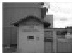
Aluguel na Rua 10 de Novembro, 30, Caldas Novas - GO. 2 quartos, sala, cozinha, banheiro, garagem.