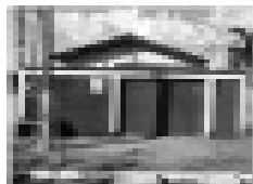
Casa nova em Itanhangá, com 3 quartos, sala, cozinha, banheiro, sala de jantar, garagem, piscina, churrasqueira, etc.