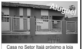
Casa no Setor Itajaí próximo a loja 100 Etiquetas com 3/4, sendo 1 suite, sl, copa, coz., área de serv., garagem.

TERRENO e loteamento Mirantes do Rio Quente Qd 16 lotes 4 e 5.