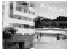
Aluguel na Rua 10 de Novembro, 30, Caldas Novas - GO. 2 quartos, sala, cozinha, banheiro, garagem.