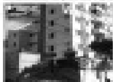
Aluguel na Rua 10 de Novembro, 30, Caldas Novas - GO. 2 quartos, sala, cozinha, banheiro, garagem.