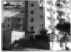
Aluguel em condomínio residencial, Rua da Fonte com 2 quartos, sala, cozinha, banheiro, garagem