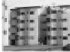
Aluguel em condomínio residencial, Rua da Fonte com 2 quartos, sala, cozinha, banheiro, garagem