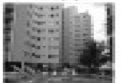
Aluguel imobiliário/Residencial. Próximo ao Fórum, sala, cozinha, banheiro, garagem.