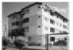
Aluguel e comércio em excelente localização. Subdivisão em 4 partes com sala, cozinha, garagem.

Shopping CTC, Salas 19/20 - Centro Caldas Novas - GO