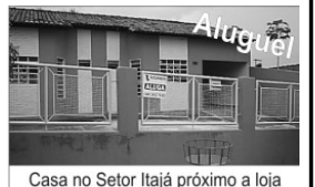
Casa no Setor Itajaí próximo a loja 100 Etiquetas com 3/4, sendo 1 suite, sl, copa, coz., área de serv., garagem.

TERRENO e loteamento Mirantes do Rio Queiroz Qd 16 lotes 4 e 5.