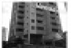
Aluguel em excelente localização. Próximo ao Fórum, sala, cozinha, banheiro, garagem.