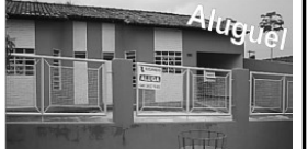
Casa no Setor Itajaí próximo a loja 100 Etiquetas com 3/4, sendo 1 suite, sl, copa, coz., área de serv., garagem.

TERRENO e loteamento Mirantes do Rio Queiroz Qd 16 lotes 4 e 5.