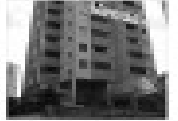
Aluguel em condomínio residencial na Rua 13, Caldas Novas, GO. 2 quartos, sala, cozinha, banheiro, garagem.