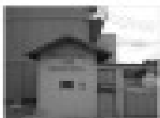
Aluguel na Rua 13, Caldas Novas, GO. 2 quartos, sala, cozinha, banheiro, garagem.