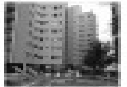
Aluguel em condomínio residencial na Rua 13, Caldas Novas, GO. 2 quartos, sala, cozinha, banheiro, garagem.