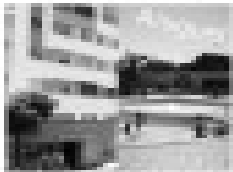
Aluguel na Rua 13, Caldas Novas, GO. 2 quartos, sala, cozinha, banheiro, garagem.