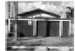
Casa nova em Itanhangá com 3 quartos, sala, cozinha, banheiro, garagem, piscina.