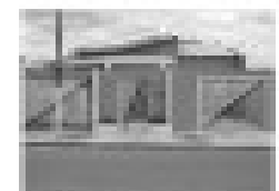
Casa Nova em Itanhangá com 3 quartos, sala, cozinha, banheiro, garagem, piscina.