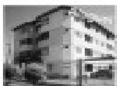
Opção e oportunidade para quem deseja investir em um imóvel com estacionamento, segurança e ponto comercial próximo a uma garagem.

Shopping CTC, Solos 19/20 - Centro - Cidades Novas - GO