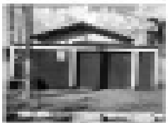
Casa para alugar no Res. Itaguará, com 3 quartos, sala, cozinha, banheiro, garagem e ponto comercial.