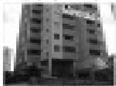
Apartamento 2 quartos no Residencial Itajaí-Rio, com 2 quartos, sala, cozinha, banheiro, garagem e ponto comercial.