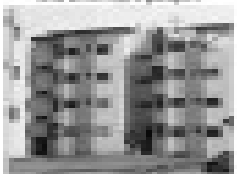
Área no Residencial Boa Vista com 4 quartos, sala, cozinha, banheiro, garagem e ponto comercial.