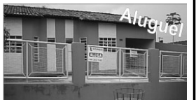
Casa no Setor Itajaí próximo a loja 100 Etiquetas com 3/4, sendo 1 suite, sl, copa, coz., área de serv., garagem.

TERRENO e loteamento Mirantes do Rio Queiroz Qd 16 lotes 4 e 5.