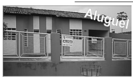
Casa no Setor Itajá próximo a loja 100 Etiquetas com 3/4, sendo 1 suíte, sl, copa, coz., área de serv., garagem.

TERRENO e lotea-mento Mansões do Rio Quente Qd 16 lotes 4 e 5.