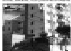
Aluguel 1 casa com 3 quartos, A/C, fogão, geladeira e novo Pium