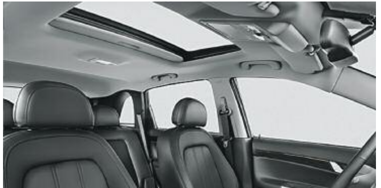
Chevrolet Captiva - Adoção do teto solar com acionamento elétrico

O veículo pode ser equipado com diversos acessórios na rede de concessionárias, como central multimídia com GPS e câmera de ré, sensor de estacionamento dianteiro e traseiro, maçanetas cromadas e tablet de 7" com suporte para encosto de cabeça.