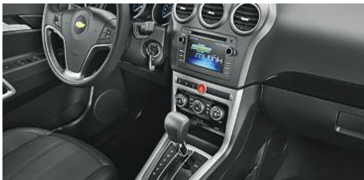
Chevrolet Captiva - Novo multimídia Chevrolet MyLink com a função áudio streaming

teratividade, é possível realizar as mudanças de maneira manual. Basta colocar a alavanca na posição "M" e pressionar as teclas "+" ou "-" na alavanca da transmissão.