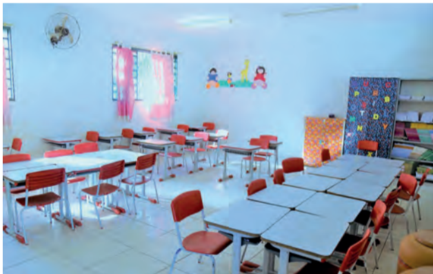
Realidade em Novo Gama, salas em pleno funcionamento e estrutura, mas sem professores suficientes