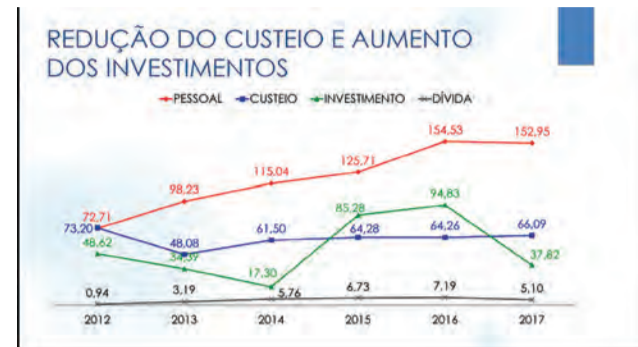
FOTO 02 - Redução do custeio e aumento dos investimentos de Águas Lindas de Goiás