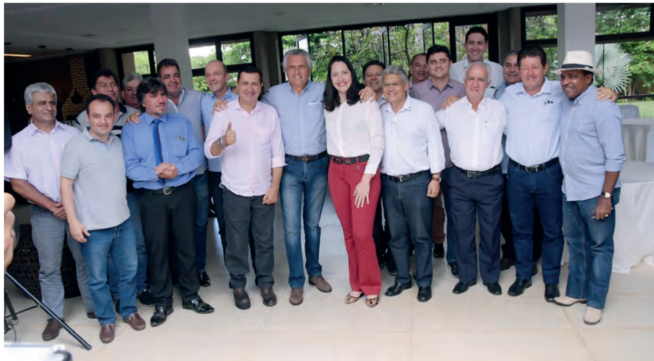
O governador Ronaldo Caiado e prefeitos do Entorno em busca de soluções para os municípios