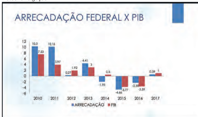
Arrecadação Federal x PIB