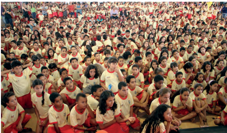
Alunos de Águas Lindas beneficiados após o TAC