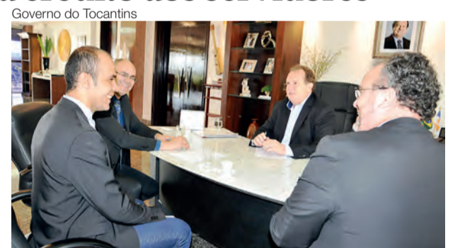
Governo do Tocantins

“Isso é resultado da redução de despesas que fizemos. Com esse corte de gastos, está sendo possível quitar dívidas como essa dos consignados, que já estavam desde a gestão passada, e pagar contrapartida de obras que estavam