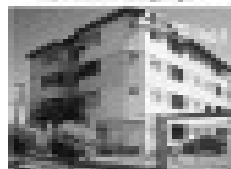
Imóvel comercial em área nobre, próximo ao shopping CTC, com 100m² de área, ideal para comércio ou escritórios.