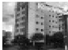
Imóvel comercial em área nobre, próximo ao shopping CTC, com 100m² de área, ideal para comércio ou escritórios.