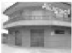
Imóvel comercial em área nobre, próximo ao shopping CTC, com 100m² de área, ideal para comércio ou escritórios.