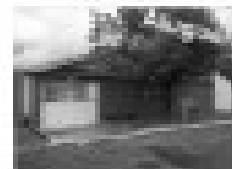
Imóvel comercial em área nobre, próximo ao shopping CTC, com 100m² de área, ideal para comércio ou escritórios.