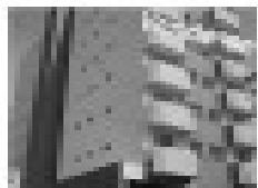
Imóvel comercial em área nobre, próximo ao shopping CTC, com 100m² de área, ideal para comércio ou escritórios.