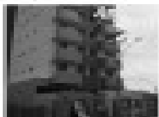
Imóvel comercial em área nobre, próximo ao shopping CTC, com 100m² de área, ideal para comércio ou escritórios.