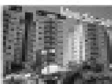
Imóvel comercial em área nobre, próximo ao shopping CTC, com 100m² de área, ideal para comércio ou escritórios.

Shopping CTC, Sala 1008 - Centro Dulce Moura - GO