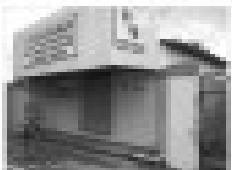
Imóvel comercial em área nobre, próximo ao shopping CTC, com 100m² de área, ideal para comércio ou escritórios.