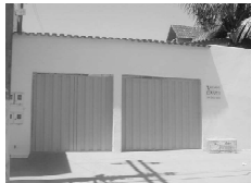
CASA na Nova Vila para aluguel, av. B, 3/4 sendo 1 suite, sala, coz., 2 garagens