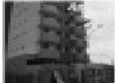
Apto. mobilado - 02 quartos - 2 banheiros - sala ampla - cozinha completa - terraço - garagem - 100 m² - 120.000,00