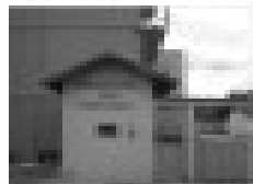
Apto. mobilado - 02 quartos - 2 banheiros - sala ampla - cozinha completa - terraço - garagem - 100 m² - 120.000,00