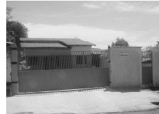
CASA na Estância dos Buritis para aluguel, com 3 quartos, sendo 1 suite, sala, coz., 2 garagens