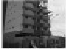
Apto. no Res. Varanda dos Buritis com 02 quartos, sala, cozinha, banheiro social, 2 sacadas (piscina e garagem)