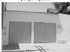
CASA na Nova Vila para aluguel, av. B, 3/4 sendo 1 suite, sala, coz., 2 garagens