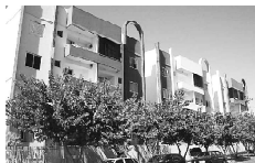
APTO. no Res. Varanda dos Buritis para aluguel com 1 quarto, sala, cozinha, banheiro social, garagem, parque aquático.