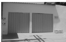
CASA na Estância dos Buritis para aluguel, com 3 quartos, sendo 1 suite, sala, coz., 2 garagens