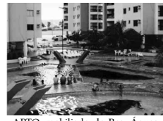
APTO. mobiliado do Res. Águas da Fonte com 1 quarto, sala, cozinha, banheiro social, sacada, com parque aquático