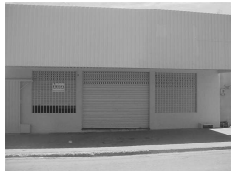
Sala Comercial para aluguel na Av. C. Itaguaí II com 100 m².