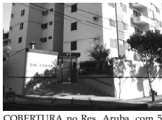
COBERTURA no Res. Aruba, com 5 quartos, sendo 4 suites, sala, cozinha, banheiro social, sacadas, área de serviço, garagem, piscina