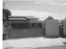
CASA na Estância dos Buritis para aluguel, com 3 quartos, sendo 1 suite, sala, coz., 2 garagens