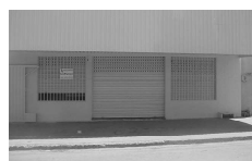
Sala Comercial para aluguel na Av. C. Itaguaí II com 100 m²