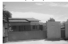
CASA na Estância dos Buritis para aluguel, com 3 quartos, sendo 1 suite, sala, coz., 2 garagens