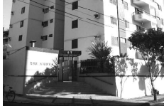
COBERTURA no Res. Aruba, com 5 quartos, sendo 4 suites, sala, cozinha, banheiro social, sacadas, área de serviço, garagem, piscina