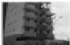
Apto. no Res. Varanda dos Buritis com 02 quartos, sala, cozinha, banheiro social, garagem, piscina e garagem