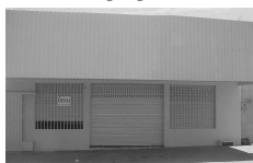
Sala Comercial para aluguel na Av. C. Itaguaí II com 100 m².