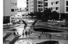
APTO. mobiliado no Res. Águas da Fonte com 1 quarto, sala, cozinha, banheiro social, sacada, com parque aquático