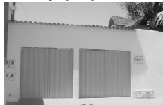
CASA na Nova Vila para aluguel, av. B, 3/4 sendo 1 suite, sala, coz., 2 garagens