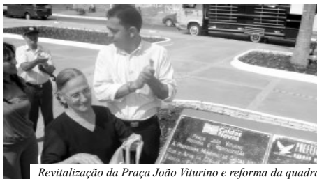
Revitalização da Praça João Vitorino e reforma da quadra poliesportiva Osvaldo Nascimento - Bairro Nova Vila