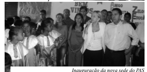
Inauguração da nova sede do PAS Programa Ação e Saúde - Vila Multirão - Rua 24