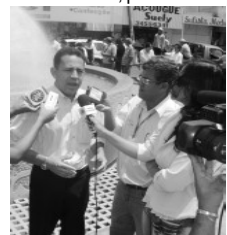
Prefeito concede entrevista