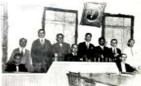
Foto: Primeira sessão na Câmara

Ao chegarmos em Caldas Novas percebemos que é uma cidade em construção. Prédios, ruas, bairros inteiros surgem numa velocidade que muitas