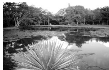
Foto: Lagoa de Pirapitinga