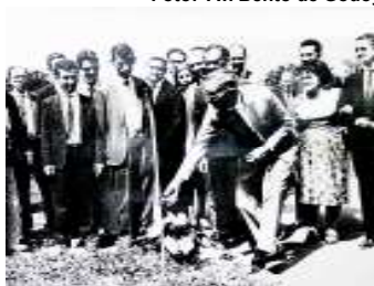
Jardim Público inauguração Serviço de Água