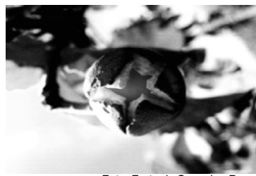
Foto: Fruto do Serrado - Pequi