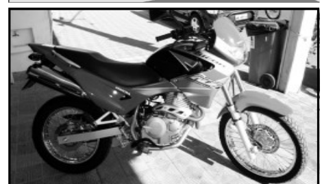
Honda Falcon 400 cilindradas ano 2005 vermelha único dono, documentação em dia tratar 9994-4092