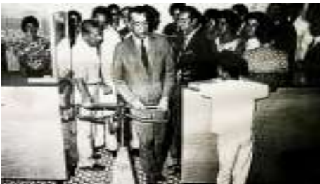
Foto: JK em Campanha eleitoral em Caldas Novas

desenvolvimento destes lugares, sendo estas cidades verdadeiros monumentos do luxo e da opulência que este minério podia comprar, em nossa região, as águas termais,