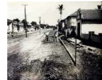
Foto: Av. Bento de Godoy