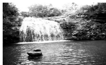
Foto: Cascatinha Serra de Caldas Novas

Vale a pena conhecer este espaço em Caldas Novas e, além disso, esta artista que uniu o útil ao agradável. Como ela mesmo diz: "O artista não tem limites".