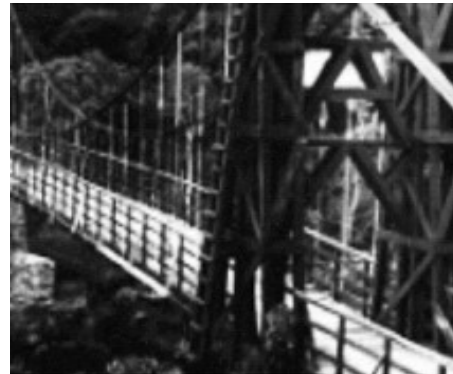
Foto: Ponte sobre o Rio Corumbá

Mas ainda, Caldas Novas continua com sua vida pacata e familiar. Onde hoje é o Sambódromo, ao lado da prefeitura, existia o tamboril. Uma árvore frondosa onde os viajantes e tropeiros amarravam os seus animais. Logo abaixo, onde hoje se encontra o Balneário Municipal (a atual construção data do ano de 1939), se encontravam as "casas de banho", construções rústicas com banheiras. A energia chega