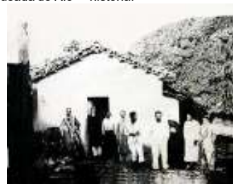
Primeiro Balneário - 1920