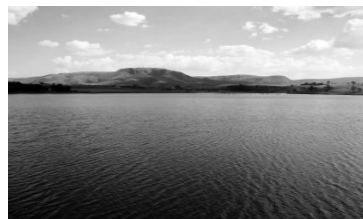
Foto: Lago de Corumbá