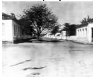
Foto: Rua Pedro Branco de Souza