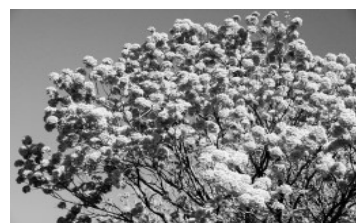
Ipê Roxo